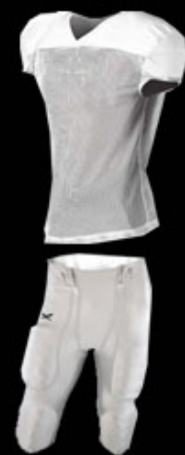
Helm Männer + A Jugend

Ausnahme ist der Helm. Dieser ist auf jeden Fall in der Saison Lack Schwarz für Männer + A Jugend, Helm B Jugend Matt Schwarz und mit Helmaufklebern (Helmschweine bzw. R) versehen zu tragen.